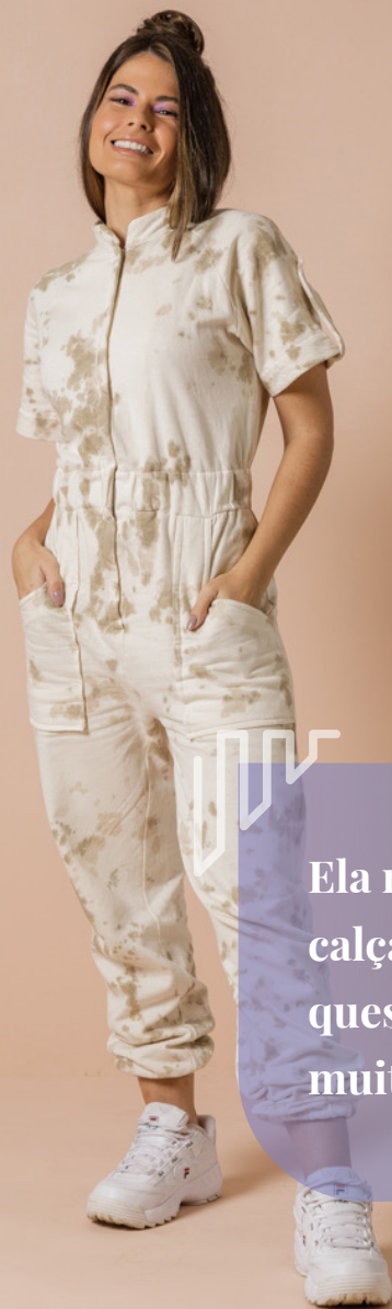
Eduarda Galvani Atelie - Coleção Raízes

Você lembra de algum produto/tendência específico que apostou com base nos nossos direcionamentos e deu certo?