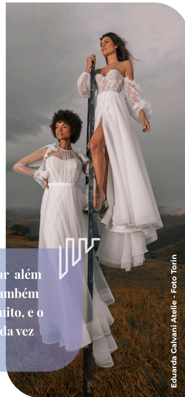
Eduarda Galvani Atelier

A gente conseguiu entregar além de produto, entregamos também conteúdo, isso agregou muito, e o nosso consumidor está cada vez mais interessado.